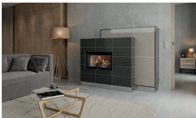
Moderne Kachelöfen nutzen den regenerativen und CO 2 -neutralen Brennstoff Holz hocheffizient und umweltfreundlich.