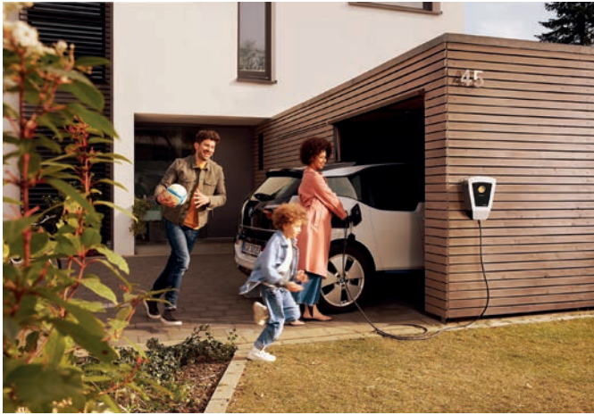
Ob zu Hause oder unterwegs: Das Laden des E-Autos sollte mittlerweile kein Problem mehr sein.

E-Autos: Auch nach der Streichung des Umweltbonus bleiben die Preise attraktiv