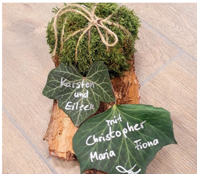
Im Bestattungswald sind nur natürliche Materialien gestattet.