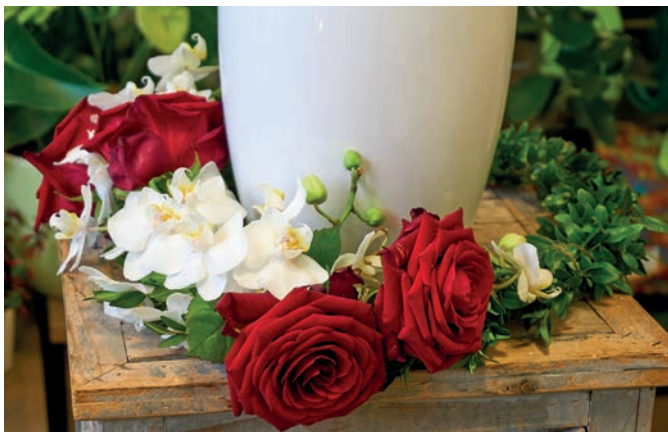
Gedenkfloristik für den Bestattungswald aus rein natürlichen Materialien.

Würdevoller Abschied mit rein natürlichem Blumenschmuck Teil 3