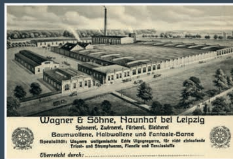
Wagner & Söhne, Naunhof bei Leipzig Spinnerei, Zulfabrik, Färberei, Bleicherei Baumwollene, Halbwoollene und Fantasie-Barme Spezialität: Wagners weltbekannte Edel-Vogelgarne, für nicht einlösende Triest- und Strumpfwaren, Plüsch- und Tencisstoffe Überreicht durch: