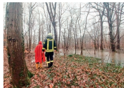
Kontrollbegehung der Parthe am Wehr in Lindhardt am 25. Dezember

Punkte wurden durch Begehungen ermittelt, Wege und Brücken für Passant/innen gesperrt und Vorbereitungen für die nächste Alarmstufe getroffen. Am 26. Dezember entspannte sich die Lage glücklicherweise wieder. Dafür erfolgte gegen Mittag die nächste Alarmierung der Feuerwehr. In Fuchshain benötigte man für den Transport eines Patienten