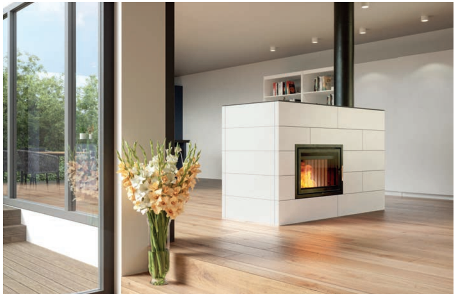
Erneuerbare Energie der Zukunft: Moderne Holzfeuerstätten sind als nachhaltige Wärmequelle auch im Neubau zugelassen.

Der natürliche Brennstoff Holz ist eine der umweltfreundlichsten Wärmequellen. Holz ersetzt fossile