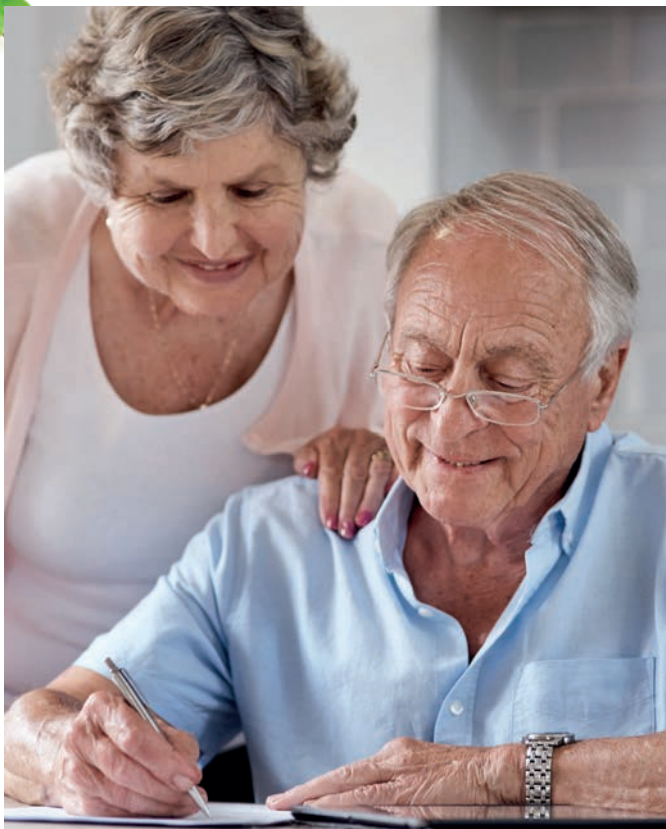
Ehegatten sowie eingetragene Lebenspartner können ein gemeinschaftliches Testament errichten.

Es weht der Wind ein Blatt vom Baum, von vielen Blättern eines. Das eine Blatt, man merkt es kaum, denn eines ist ja keines. Doch dieses Blatt allein war Teil von unserem Leben, drum wird dies Blatt allein uns immer wieder fehlen.