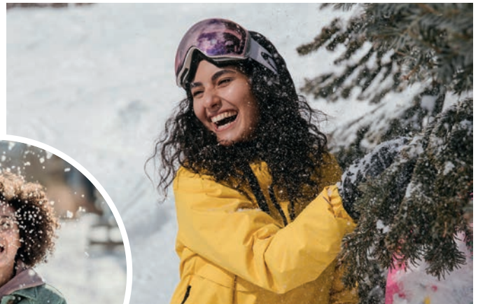
Den Winter unbeschwert genießen: Dafür sind besonders im Skiurlaub UV- und Kälteschutz gefragt.