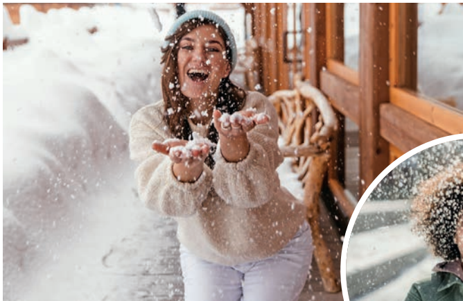
Kälte – na, und? Mit der richtigen Pflege ist die Haut auch in der kühlen Jahreszeit gut gewappnet.

In der kalten Jahreszeit ist besondere Pflege gefragt