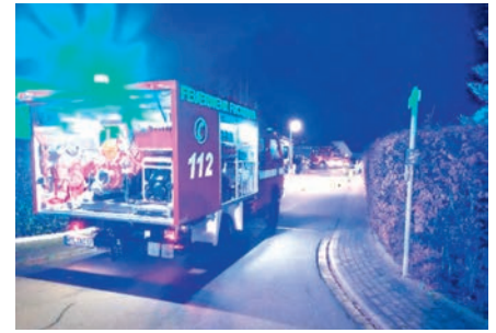
Einsatz in der Silvesternacht in Fuchshain

Koniferenbäume Feuer gefangen, welches jedoch durch schnelles Handeln von Anwohnern bis zum Eintreffen der Feuerwehr gelöscht werden konnten. Trotzdem war die Wärmeentwicklung so groß, dass die Dachverkleidung des angrenzenden Wohngebäudes geschmolzen war; auch der Dachboden war stark verqualmt. Glück im Unglück – keine der Personen im Gebäude hat davon Schaden genommen.